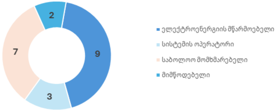
ნახაზი 1. 2025 წლის 31 მარტის მდგომარეობით ბირჟაზე რეგისტრირებული მონაწილეები

2025 წლის 31 მარტის მონაცემებით დღით ადრე აუქციონში მონაწილეობისათვის ბირჟაზე რეგისტრირებული იყო 21 მონაწილე. რეგისტრირებული მონაწილეების სია, ბაზრის წესების შესაბამისად, გამოქვეყნებულია სენბის ვებ-გვერდზე .